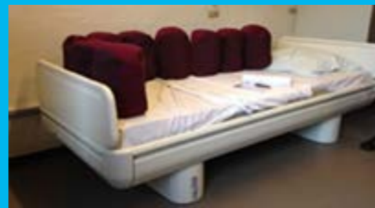
OPI-projektet 'Fremtidens Psykiatriske Seng'

Siden OPI-projektets afslutning har netværkskonsortiet vundet en udbudsrunde, 'Psykiatrien i Region Syddanmark' og 'Region Hovedstadens Psykiatri' lanceret i 2014.